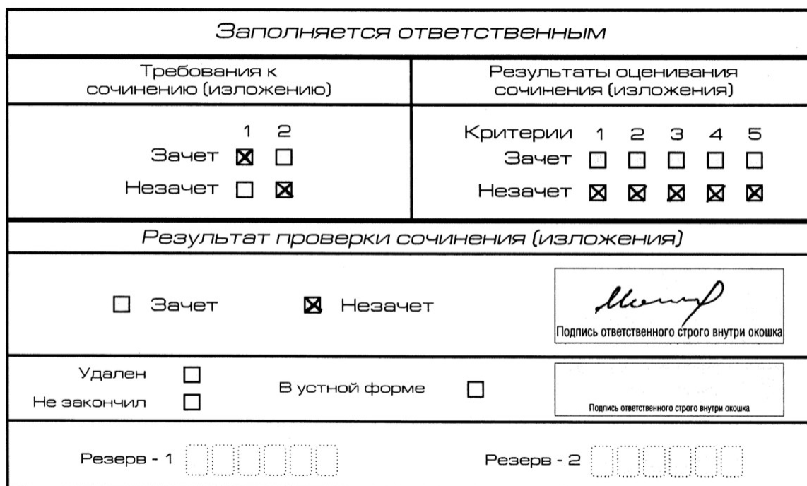
Рис. 7. Область для оценки работы

Если итоговое сочинение (изложение) соответствует требованию № 1 и требованию № 2, то выставляется «зачет» за выполнение требования № 1 и требования № 2. Указанные сочинения (изложения) далее оцениваются по критериям.