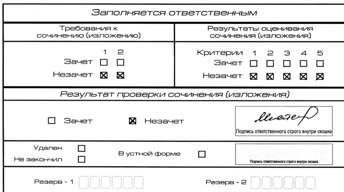
Рис. 6. Область для оценки работы