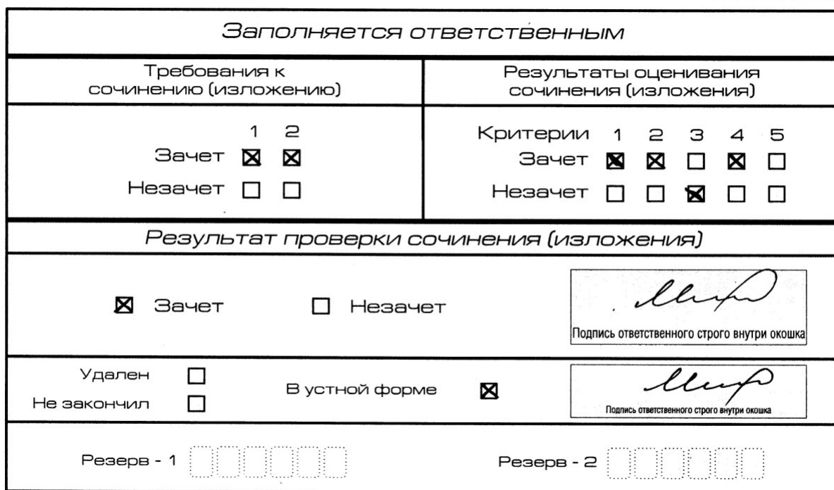
Рис. 9. Область для оценки работы сочинения (изложения) в устной форме

После окончания заполнения бланка регистрации ответственное лицо ставит свою подпись в специально отведенном для этого поле.